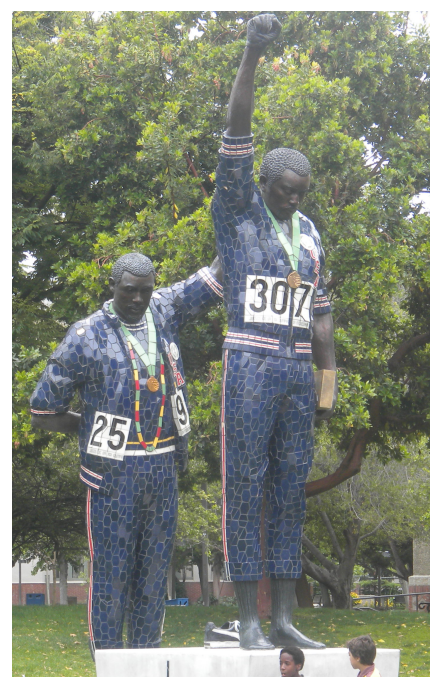
Rigo 23. 2005 San Jose State University campus, U.S.A.