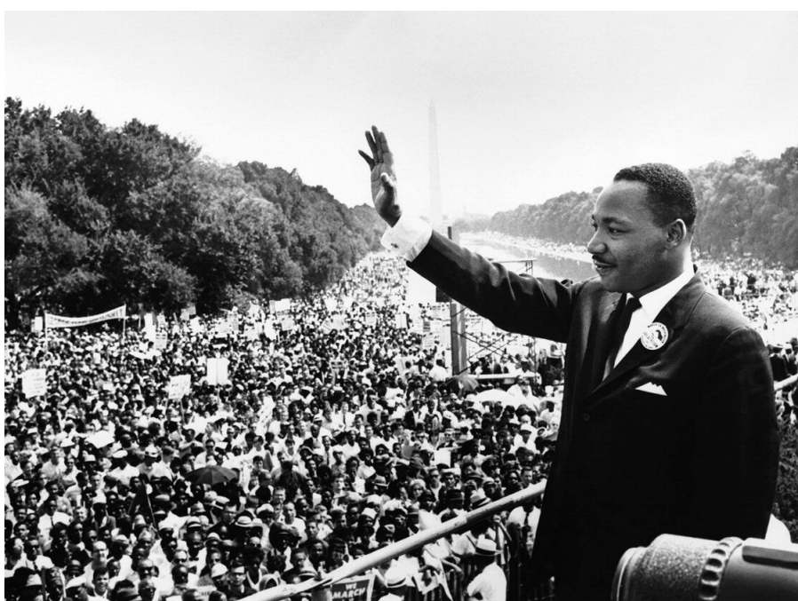
Martin Luther King Jr. "I have a dream" Né le 15 janvier 1929 à Atlanta (Géorgie) Mort assassiné le 4 avril 1968 à Memphis (Tennessee)