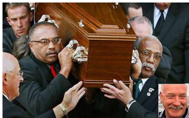
En 2006, Peter Norman décède : John Carlos et Tommie Smith se rendent en Australie et portent le cercueil de leur camarade de lutte resté dans l'oubli.