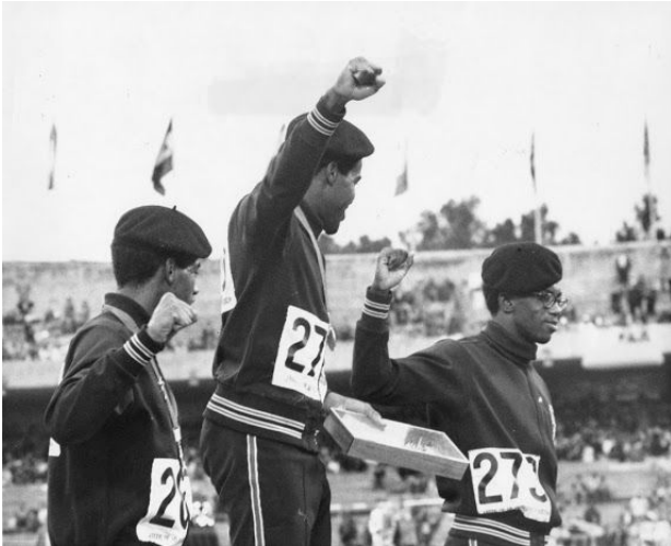
18 octobre 1968: J.O de Mexico, le podium moins connu des « Panthers ». Le podium du 400 mètres. De gauche à droite: Larry James, Lee Evans et Ron Freeman